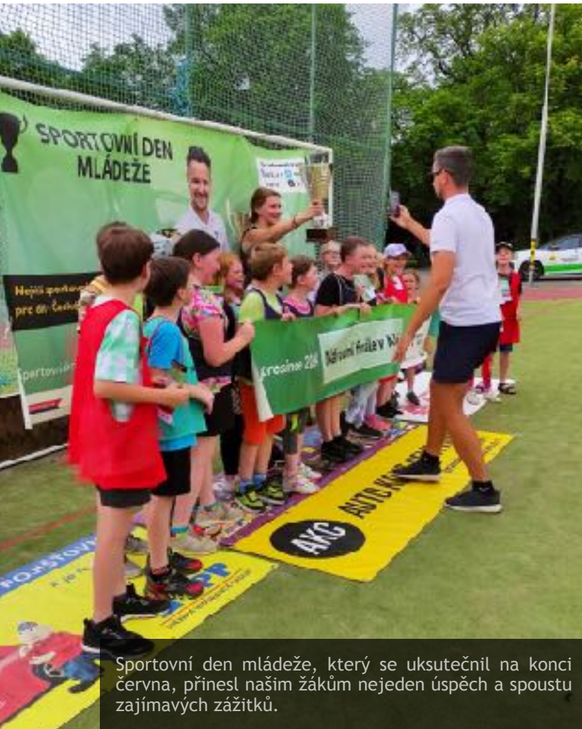
Sportovní den mládeže, který se uskutečnil na konci června, přinesl našim žákům nejen jeden úspěch a spoustu zajímavých zážitků.