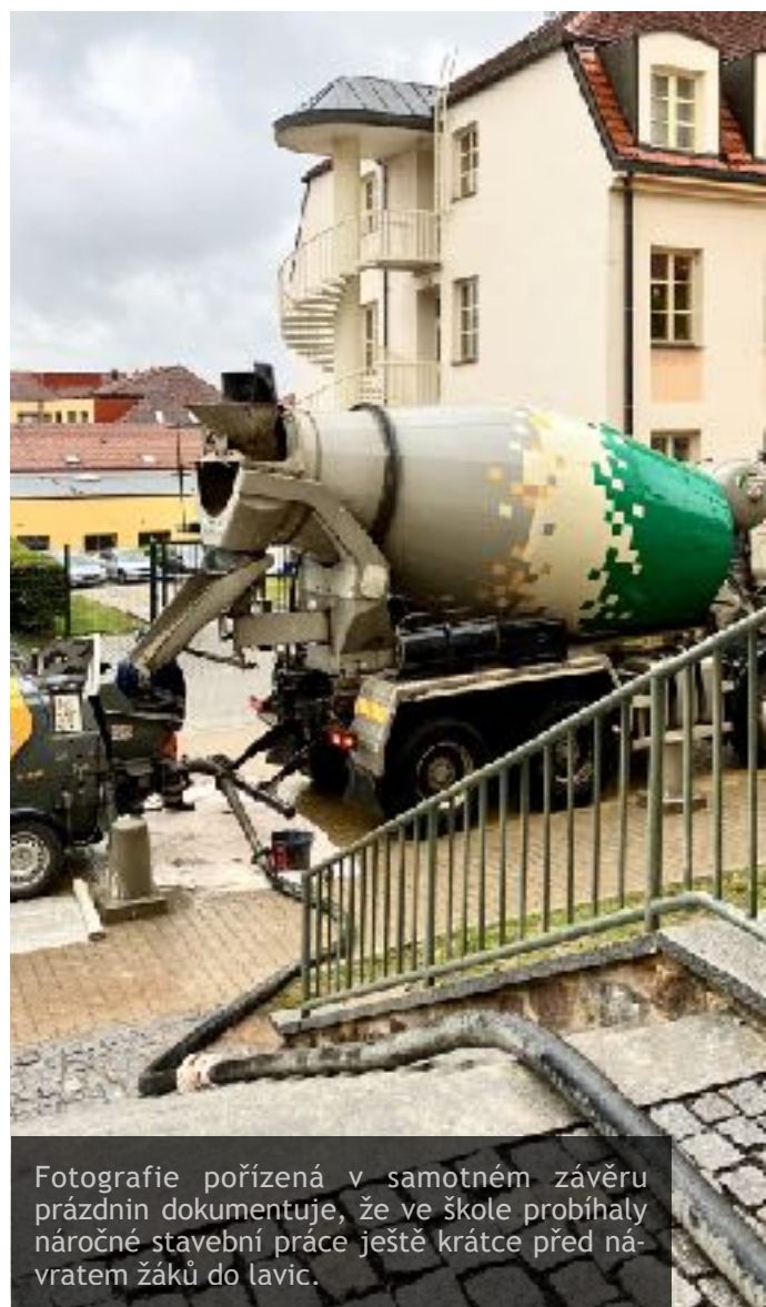
Fotografie pořízená v samotném závěru prázdnin dokumentuje, že ve škole probíhaly náročné stavební práce ještě krátce před návratem žáků do lavic.