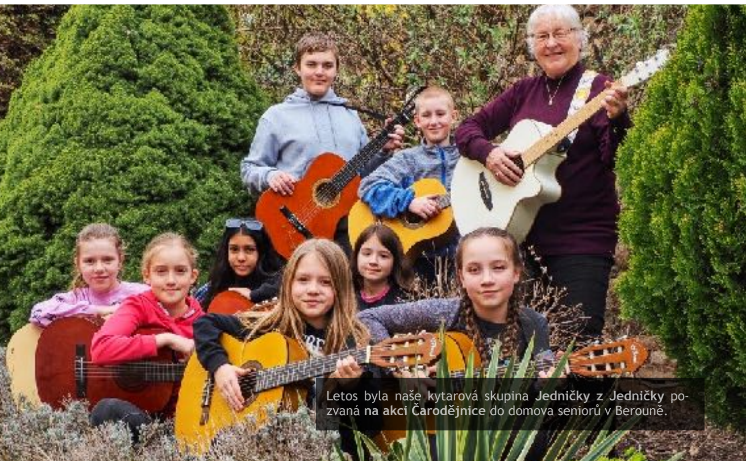
Letos byla naše kytarová skupina Jedničky z Jedničky pozvána na akci Čarodějnice do domova seniorů v Berouně.