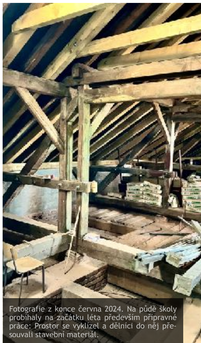
Fotografie z konce června 2024. Na půdě školy probíhaly na začátku léta především přípravné práce: Prostor se vyklízel a dělníci do něj přesouvali stavební materiál.

V roce 2012 proběhla rozsáhlá rekonstrukce historické části města. Z nákladné akce realizované zřizovatelem profitovala také škola: bylo vybudováno nové schodiště, opravena opěrná zeď, dále byl předlážděn a odvodněn ochoz a založena nová zeleň. Lokalita, ve které se škola nachází, patří bez přehánění k nejkrásnějším v celém městě.