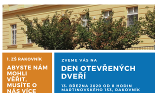
ZVEME NA DEN OTEVŘENÝCH DVEŘÍ