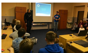
O BESEDÁCH SE ZAJÍMAVÝMI LIDMI