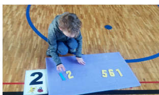
RAKOVNICKÉ ŠKOLKY HOSTY I.B