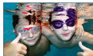
PLAVÁNÍ ZPÁTKY V RAKOVNÍKU