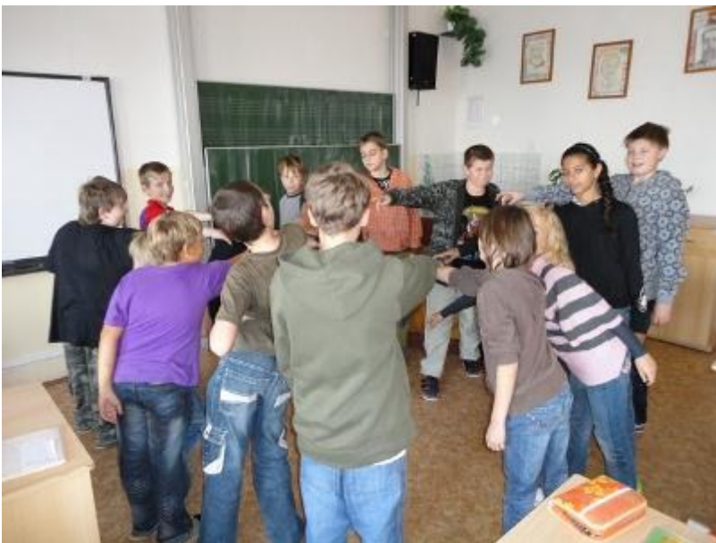
Fotografie ze Dne jazyků, který se na naší škole konal 21. září