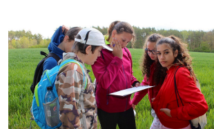
DEN ZEMĚ 2019