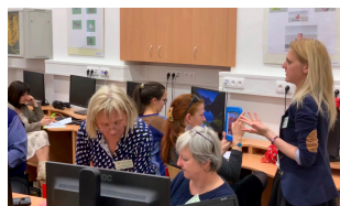
OD WINTRA AŽ NA VYSOČINU