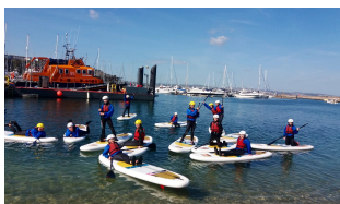
POZNALI JSME NEOB- VYKLOU TVÁŘ ANGLIE