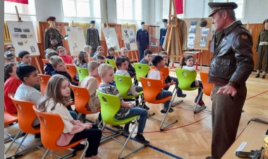
Výstava k 80. výročí výsadku

1. ZÁKLADNÍ ŠKOLA MARTINOVSKÉHO 153 269 01 RAKOVNÍK