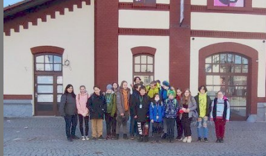
Výstava Světy české animace