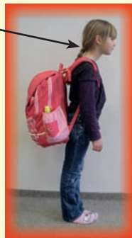
Příliš dlouhé popruhy s odstávající brašnou dítě kompenzuje a/ předsunem hlavy b/ zvýšeným bederním prohnutím