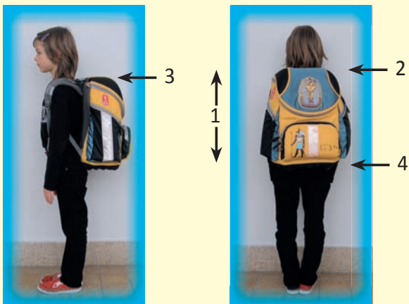
Správná velikost a umístění brašny

1. Materiál - brašna by měla být z vodě odolného materiálu, kvalitně zpracovaná (nýty, funkčnost zipů, snadno ovladatelné uzávěry).