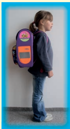
Správně nastavená délka popruhů