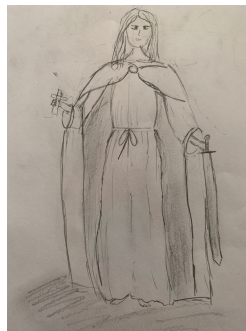
Iveta Linhartová 7. A