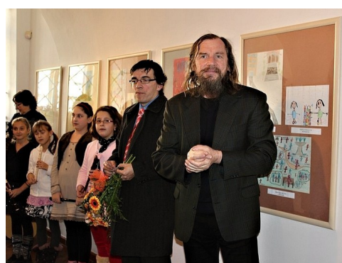
Z vernisáže výtvarných prací 8. 1. 2014.