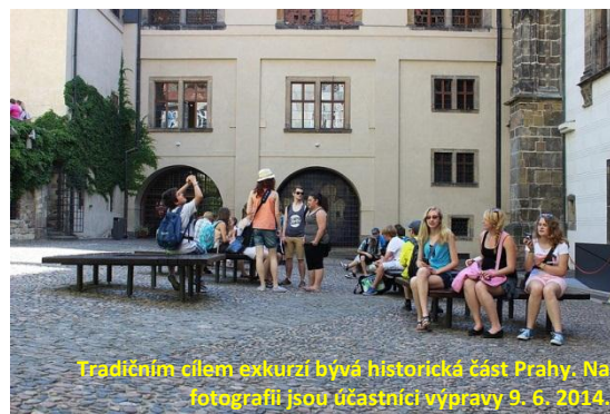
Tradičním cílem exkurzí bývá historická část Prahy. Na fotografii jsou účastníci výpravy 9. 6. 2014.

Mezi tradiční partnery školy v této oblasti patří DDM Rakovník a Městská knihovna Rakovník. Zejména knihovna svými vlastními programy případně programy zprostředkovanými garantuje škole vysokou kvalitu služeb.