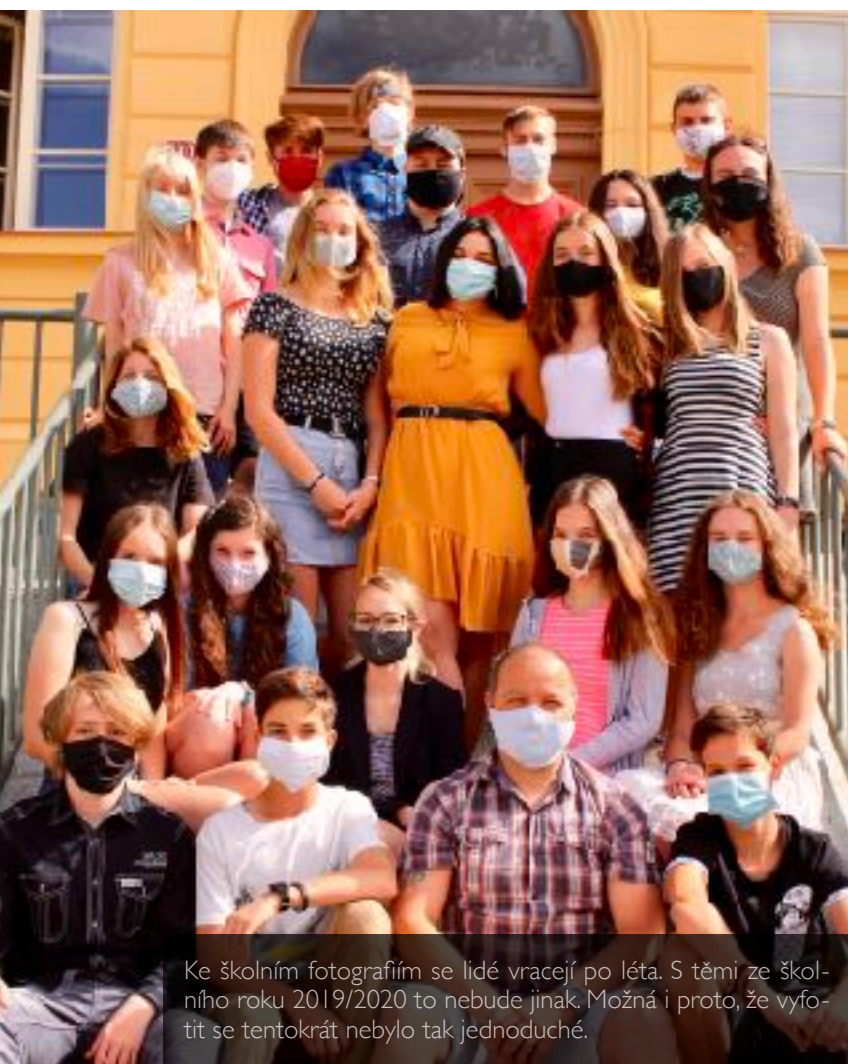
Ke školním fotografiím se lidé vracejí po léta. S těmi ze školního roku 2019/2020 to nebude jinak. Možná i proto, že vyfotit se tentokrát nebylo tak jednoduché.