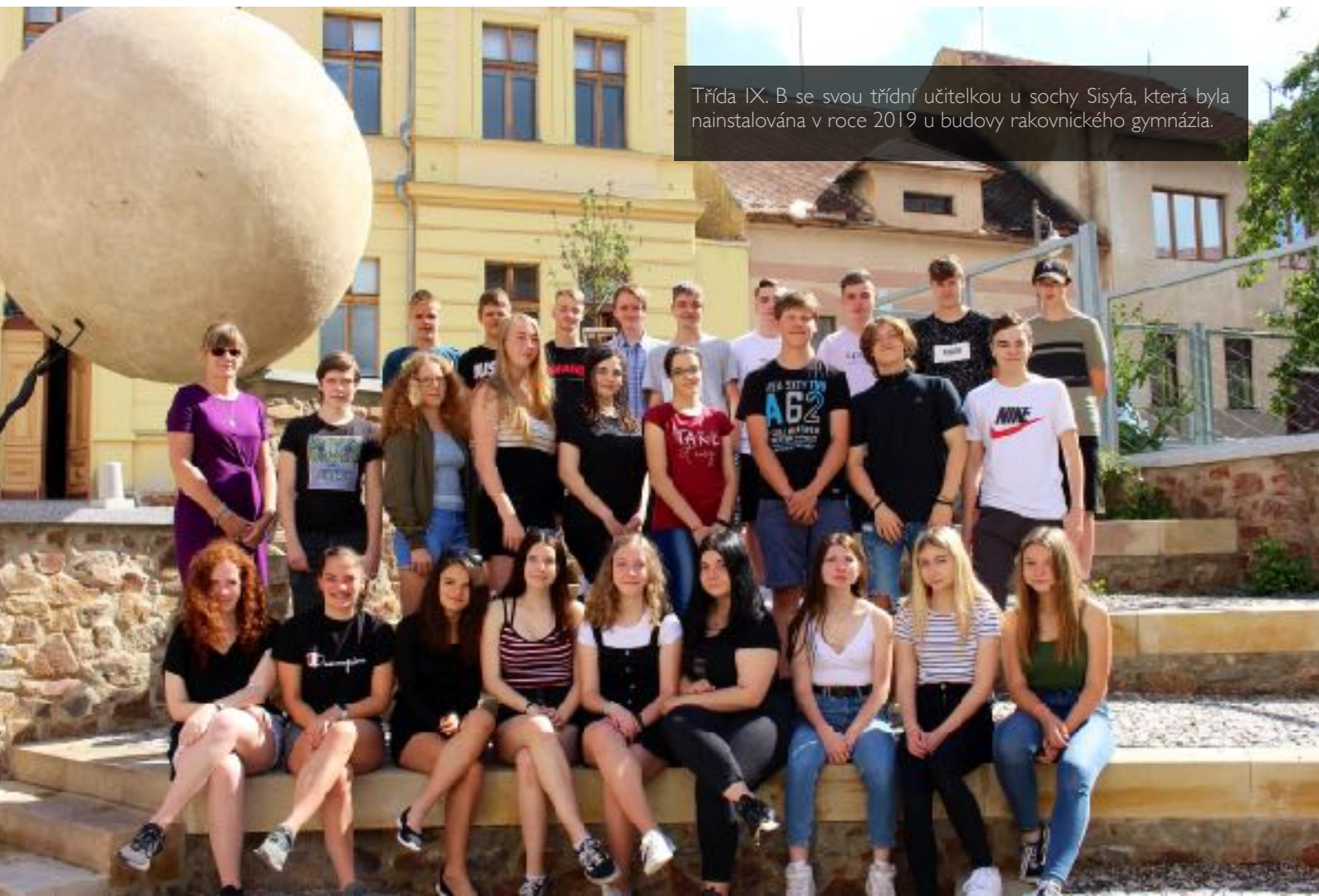
Třída IX. B se svou třídní učitelkou u sochy Sisyfa, která byla nainstalována v roce 2019 u budovy rakovnického gymnázia.

Rakovník - elektrotechnika 2, informační technologie 1, elektrikář 1, strojní mechanik 3, Masarykova obchodní akademie Rakovník - obchodní akademie 3, ekonomické lyceum 2, Střední zemědělská škola Rakovník - agropodnikání 2, chovatelství - 1, Integrovaná střední škola Rakovník - cestovní ruch 2, Střední odborné učiliště Nové Strašecí - opravář zemědělských strojů 6, mechanik opravář motorových vozidel 3, zahradník 3, Střední škola řemesel a služeb Stochov - kosmetické služby 1, operátor skladování 1, Střední škola Kralovice - sociální činnost 2, Obchodní akademie, Střední pedagogická škola a Střední škola Beroun - předškolní a mimoškolní pedagogika 1, Střední zdravotnická škola Beroun - praktická sestra 3, Střední zdravotnická škola Kladno - praktická sestra 1, Střední odborná škola a Střední odborné učiliště Kladno - mechanik elektrotechnik 1, Karlínská obchodní akademie a VOŠE Praha - obchodní akademie 1, Vyšší odborná škola ekonomických studií, Střední průmyslová škola potravinářských technologií a Střední odborná škola ekologická a veterinární Praha - přírodovědné lyceum 1, Vyšší odborná škola ekonomická, sociální a zdravotnická, Obchodní akademie, Střední pedagogická škola a Střední zdravotnická škola Most - pedagogické lyceum 1. Z 8. ročníku byl jeden žák přijat na Integrovanou střední školu Rakovník na obor kuchař-číšník.