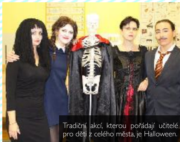
Tradiční akcí, kterou pořádají učitelé pro děti z celého města, je Halloween.