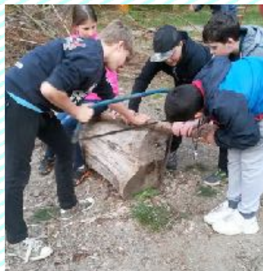
Důležitou součástí naší práce jsou adaptační pobyt žáků 6. ročníku. Konaly se na Račím hradě...