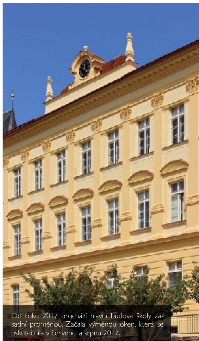
Od roku 2017 prochází hlavní budova školy zásadní proměnou. Začala výměnou oken, která se uskutečnila v červenci a srpnu 2017.

V roce 2012 proběhla rozsáhlá rekonstrukce historické části města. Z nákladné akce realizované zřizovatelem profitovala také škola: bylo vybudováno nové schodiště, opravena opěrná zeď, dále byl předlážděn a odvodněn ochoz a založena nová zeleň. Lokalita, ve které se škola nachází, patří bez přehánění k nejkrásnějším v celém městě.