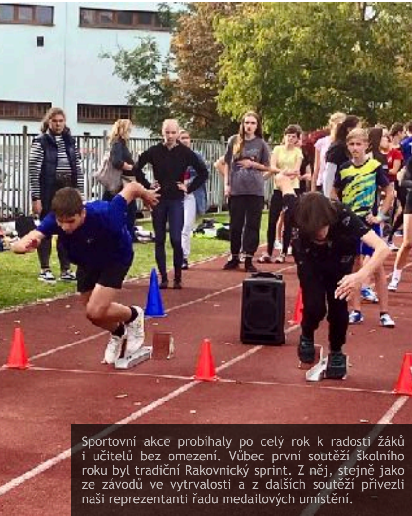
Sportovní akce probíhaly po celý rok k radosti žáků i učitelů bez omezení. Vůbec první soutěží školního roku byl tradiční Rakovnický sprint. Z něj, stejně jako ze závodů ve vytrvalosti a z dalších soutěží přivezli naši reprezentanti řadu medailových umístění.