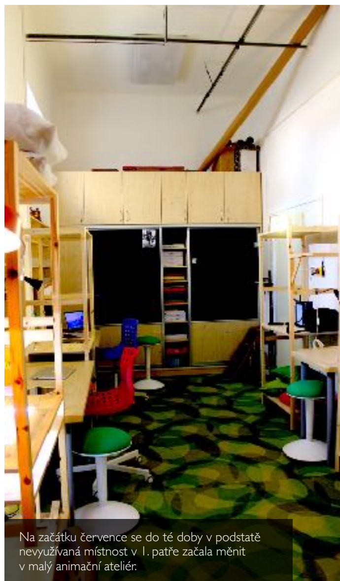
Na začátku července se do té doby v podstatě nevyužívaná místnost v I. patře začala měnit v malý animační ateliér.

K výuce využíváme 22 učeben. K dispozici máme počítačovou učebnu s patnácti žákovskými počítači a učebnu vybavenou přenosnými zařízeními, odbornou učebnu přírodopisu, cvičnou kuchyňku (o prázdninách v roce 2016 prošla kompletní rekonstrukcí), objekt školních dílen s moderním vybavením, které jsme v roce 2015 pořídili díky projektu Řemeslo má zlaté dno. Pro výuku všech předmětů využíváme učebny s interaktivními tabulemi. Všechny učebny jsou vybaveny stolními počítači s připojením na internet, kromě toho jsme investovali nemalé prostředky do realizace školní wifi sítě.