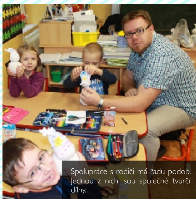
Spolupráce s rodiči má řadu podob. Jednou z nich jsou společné tvůrčí dílny.

Zapsáno bylo 50 dětí, 8 rodičů využilo možnosti a požádalo o odložení začátku povinné školní docházky o jeden rok. Všechny žádosti byly doloženy potřebnými vyjádřeními a doporučeními, což oběma stranám ušetřilo čas a lze tak říct, že změna legislativy v našem případě agendu týkající se odkladů usnadnila. V září 2017 tak škola otevře dvě první třídy.