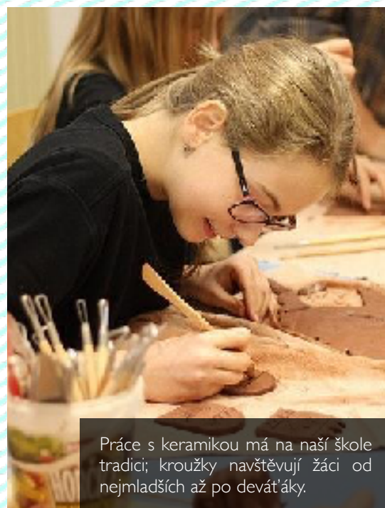
Práce s keramikou má na naší škole tradici; kroužky navštěvují žáci od nejmladších až po devátáky.

Zájmové vzdělávání zajišťuje školní družina. Její kapacita byla po celý školní rok stoprocentně naplněna. Do čtyř oddělení ŠD jsme zapsali 120 žáků 1.-5. ročníku.