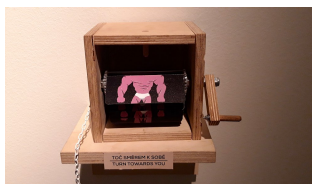
NAVŠTÍVILI JSME MUZEUM NA FILM