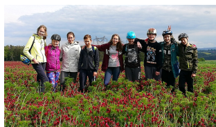
CYKLISTICKÝ KURZ NA VOJTOVĚ MLÝNĚ