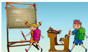
KVALITNÍ AKTOVKA JISTĚ. A CO JEŠTĚ?