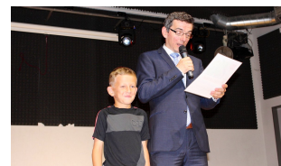
PŘEDALI JSME CENY ČTYŘLÍSTEK 2019