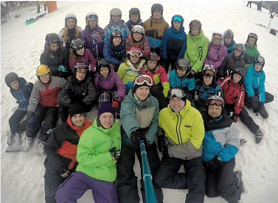
Pohled na výpravu lyžařů 2. stupně v Bedřichově.

Budoucnost je označení pro období, které ještě v toku času nenastalo. Budoucnost nelze spolehlivě předpovídat, byť se o to lidstvo věky snaží. V dubnu mohou svoji budoucnost příznivě ovlivnit naši „devátáci“ tím, že úspěšně absolvují přijímací řízení. Přejeme hodně úspěchů.