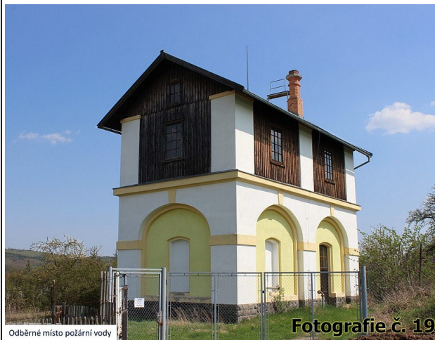
Odběrné místo požární vody

Celkem se sešlo více než dva tisíce hlasů. Nejvíce příznivců našla fotografie č. 19 - pohled na odběrné místo požární vody fotografa Aleše Zwettlera z 8. A. Autora samozřejmě odměníme, reportáž z předávání cen zveřejníme v příštím čísle. (kf)