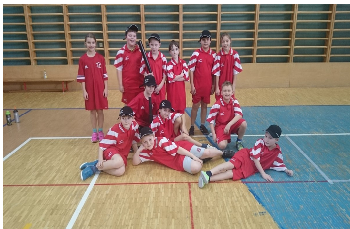
Třetí třídy skončili na třetím místě.