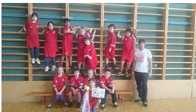
Čtvrtá třída vybojovala čtvrté místo.