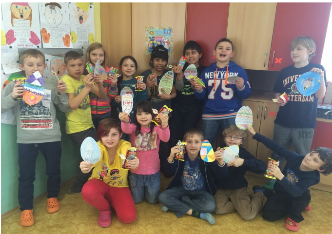
I žáci ze 4. A si vyzkoušeli anglický egg hunt.