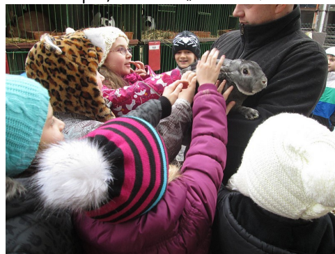
Výstavu drobného zvířectva v lednu navštívila 2. B.