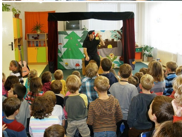
Z akcí školní družiny - pohádka Princezna na hrášku