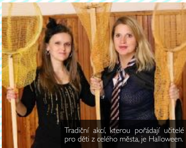
Tradiční akcí, kterou pořádají učitelé pro děti z celého města, je Halloween.