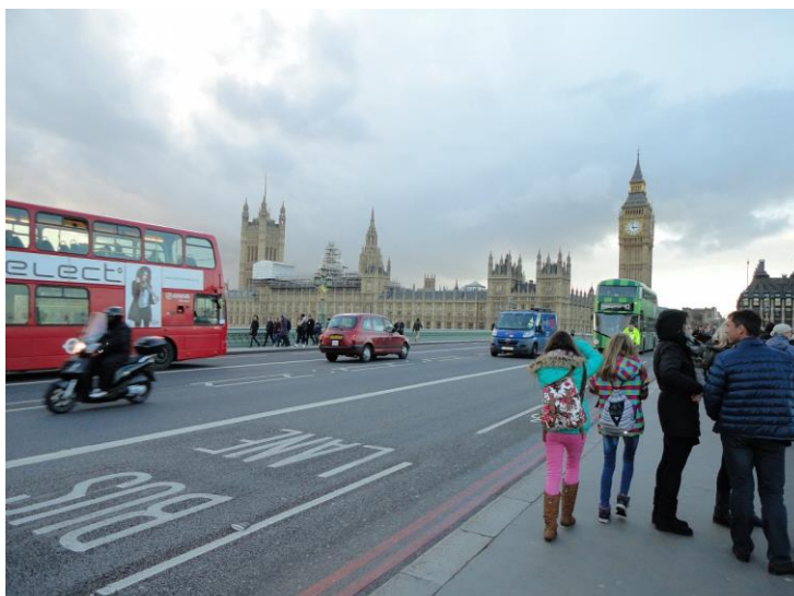
Obrázek 9 - Díky projektu Cesta ke kvalitě mohlo dvacet žáků vyrazit za poznáváním Londýna

Na konci školního roku 2014/2015 jsme předložili dvě žádosti o finanční podporu individuálních projektů ostatních pro oblast podpory 1.1 – Zvyšování kvality ve vzdělávání, Operačního programu Vzdělávání pro konkurenceschopnost. V obou případech jsme byli úspěšní. Ve Výzvě 56 jsme získali částku 694 441,- Kč na realizaci projektu Cesta ke kvalitě, Výzva 57 znamená pro naši školu získání finančních prostředků v souhrnné výši 212 481,- Kč. Samotná realizace těchto projektů připadla na září – prosinec a představovala neúměrnou zátěž pro management školy a některé z pedagogů. Na druhou stranu – bez těchto projektů bychom jen těžko byli schopni zorganizovat zahraniční pobyt žáků, studijní pobyt učitelů, vybavit školní knihovnu a pořídit nové nářadí pro školní dílnu.