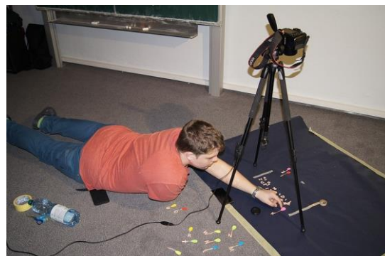
Obrázek 12 - S animačními dílnami jsme začali v roce 2015. Setkaly se s příznivým ohlasem, takže ve školním roce 2016/2017 hodláme pokračovat.

Čtvrtým rokem jsme realizovali společný projekt základních škol v Rakovníku zaměřený na rozvoj spolupráce těchto subjektů, rozšíření nabídky volnočasových aktivit žáků a prohloubení meziškolních žákovských vztahů. V rámci projektu jsme vytvořili nabídku osmi sportovních kroužků, do kterých se mohli