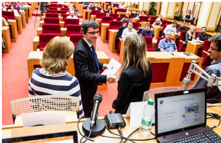
Obrázek 1 - V červnu jsme převzali cenu za třetí místo v soutěži školních webů

Naši žáci dosáhli v průběhu roku řady skvělých výsledků. Není vhodné vyjmenovávat jednotlivé úspěchy, zvláště když zejména ve sportovních soutěžích jde o desítky jmen. Příkladem za všechny může být třeba vítězství hlídky mladých zdravotníků v okresní soutěži. Naši reprezentanti se neztratili ani v krajském kole, jejich úspěch je o to viditelnější, že se mladí zdravotníci začali připravovat teprve v tomto roce a jsou tak příslibem do budoucna. Jejich úspěch, stejně jako úspěchy ostatních žáků nebo sedmadvacet žáků vyznamenaných v rámci školního programu Čtyřlístek, jsou do značné míry zásluhou našich pedagogů, kterým se na tomto místě sluší za jejich práci ve školním roce 2015/2016 poděkovat. Osobně si pak na závěr dovoluji dodat: Vážené kolegyně, vážení kolegové, těším se na spolupráci s Vámi ve školním roce 2016/2017 a přeji Vám, abyste co nejčastěji zažívali pocity z dobře vykonané práce.