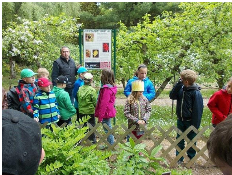
Obrázek 11 - Do botanické zahrady to má školní družina opravdu jenom kousek.

Také v tomto školním roce se kolektiv vychovatelek staral o kvalitní zajištění a organizaci volnočasových aktivit dětí. Ve spolupráci s DDM Rakovník připravoval zajímavé akce sportovní, kulturní a vzdělávací, jako např. divadelní představení, oblíbený dětský maškarní karneval, soutěž O zlatou kuličku apod. ŠD z Parku několikrát v průběhu roku navštívila Botanickou zahradu v Rakovníku, kde s vedením zahrady zajistily vychovatelky program v podobě různých přírodovědných soutěží, za které děti získávaly věcné odměny. Bruslení na ZS Rakovník je tradičně zařazeno mezi „prim“ z nabízených aktivit. Těší se stále velké oblibě u dětí i u rodičů, kteří se i aktivně zapojují do této sportovní činnosti.