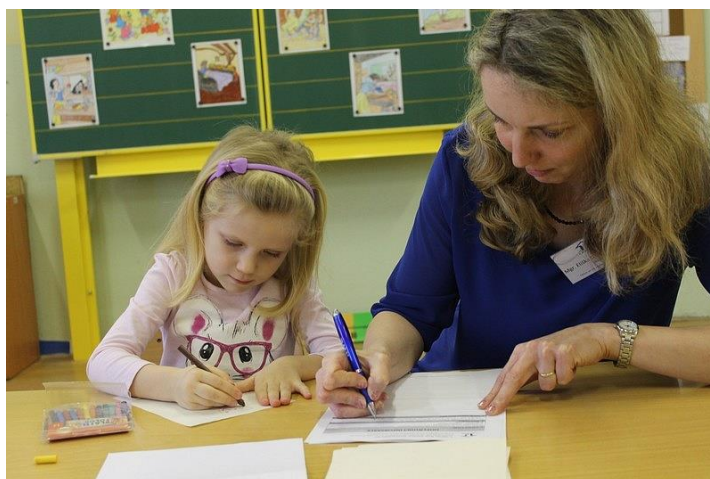
Obrázek 6 - Zápis do 1. tříd pro školní rok 2016/2017 probíhal ve dnech 11. a 12. 2. 2016

Ve školním roce 2015/2016 jsme rodičům opět nabízeli měsíční schůzky s názvem Školička, které pořádaly budoucí třídní učitelky, aby tak pomohly dětem s navázáním kontaktu s vrstevníky a dětem přiblížily školní prostředí; děti se mohly seznámit s pomůckami a některými metodami práce, poznat práci u multimediální tabule či v tělocvičně. Součástí Školiček byly také přednášky pro rodiče, které jsme souběžně s hodinovou pro děti pořádali. V listopadu přednášku o problematice výuky počátečního čtení genetickou metodou, v prosinci ukázkovou hodinu anglického jazyka, následovala beseda o školní zralosti (připravila naše zkušená elementaristka). Velké návštěvnosti se těšila Pohádková škola, která těsně předcházela zápisu, část rodičů využila také dne otevřených dveří. Počet dětí u zápisu potvrdil naše předpoklady a zapsali jsme rekordní počet dětí, který nás přinutil otevřít v září tři první třídy. Je však zřejmé, že škola našeho prostorového zázemí může kvalitní péči zajišťovat maximálně při dvou třídách v ročníku a zmíněné otevření tří paralelních tříd prvního ročníku již půjde na úkor komfortu školní družiny, která využívá prostor Omáčekovny. V příštím školním roce by otevření tří prvních tříd nebylo možné, otevírá se tak možný problém s umístěním prvňáčků ve městě, jestliže obdobnou situaci naznačuje také ředitel sousední základní školy.