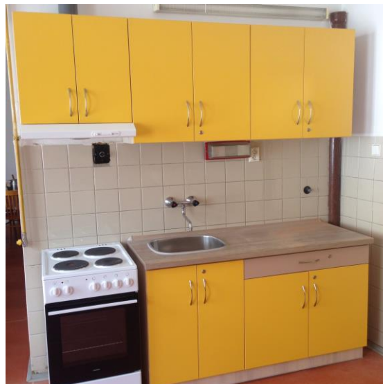
Obrázek 2 - Pohled na část opravené cvičné kuchyňky

V prázdninovém období roku 2013 vznikla v hlavní budově školní knihovna, zásadní přestavby se dočkalo