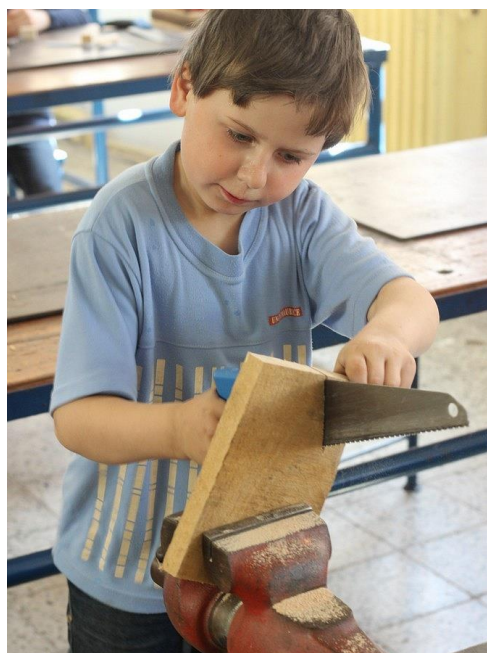
Obrázek 5 - Zvýšený zájem zažívají v posledních letech řemeslné činnosti

Máme zkušenost, že někteří žáci jsou často ochotni podílet se na organizaci řady školních akcí, ba co víc, iniciativně tyto organizovat třeba pro svoje mladší spolužáky. Tato aktivita má na naší škole zelenou. Naši žáci rozšiřují portfolio školních akcí a projektů o nové a podílejí se na proměně stávajících, sami se zdokonalují. Většina našich učitelů tak již dávno pochopila smysl spolupráce s žákem i na jiné úrovni, než jakou představuje vyučovací hodina.