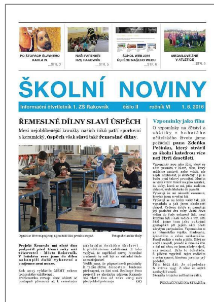
Obrázek 3 - Školní noviny získaly v roce 2016 další významné ocenění

Školní noviny si za dobu své existence našly své příznivce. Umožňují nám věnovat se některým klíčovým problémům, prezentovat stěžejní body naší práce případně informovat o vybraných aktivitách školy; existují čtenáři, kteří právě formu novin vyhledávají jako jediný zdroj informací o škole. Nepravidelně přispívají do novin také rodiče, kteří se vyjadřují k nejrůznějších problematice v pravidelné rubrice, do níž přispívá odpovědi vedení školy. Školní noviny nabízíme zájemcům v elektronické podobě (za tímto účelem nemusí nutně disponovat vlastním internetovým připojením, nýbrž