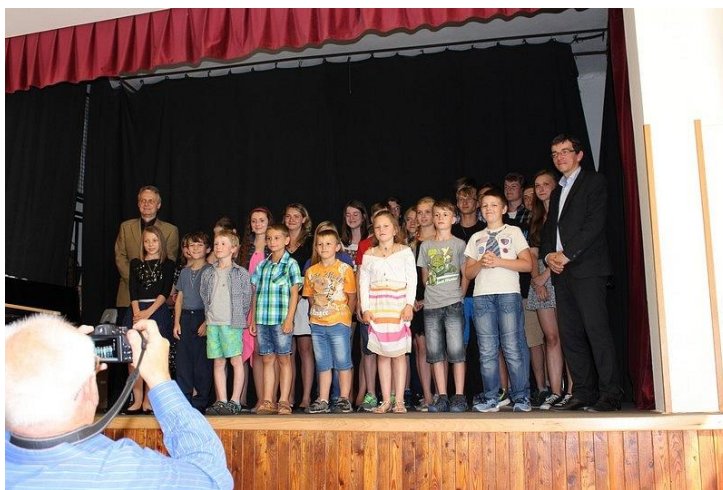
Obrázek 13 - Čtyřlístkoví žáci při slavnostním vyhlášení výsledků 27. 6. 2016.