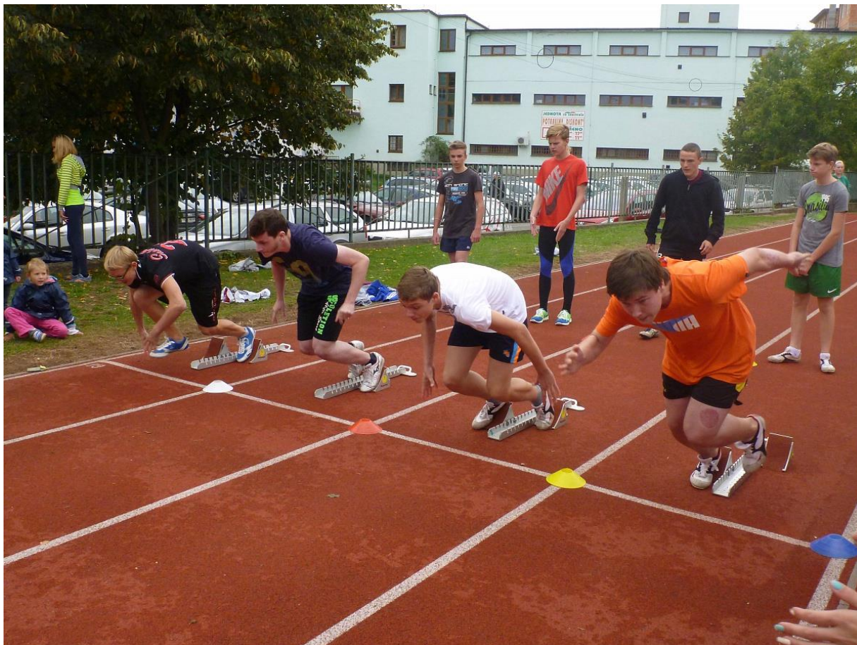
Obrázek 10 - Rakovnický sprint patří tradičně mezi první sportovní akce školního roku. Na medailové příčky pravidelně dosahují žáci obou stupňů.