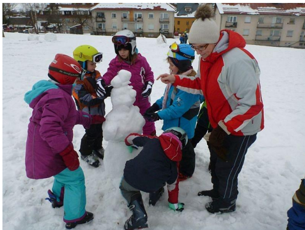
Obrázek 8 - Lyžařský výcvik se uskutečnil i přes nepřízeň počasí

Dlouhodobá podpora preventivních programů je přínosem, finanční prostředky využíváme na zajišťování adaptačních pobytů; je třeba konstatovat, že bez finanční účasti zřizovatele by šlo jen obtížně docílit stoprocentní účasti žáků, čímž by adaptační pobyt ztrácel na významu. Obzvláště pak z toho důvodu, že jej zajišťujeme pro žáky šestého ročníku, pro které je zvládnutý adaptační proces extrémně důležitý.