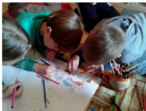
Obrázek 4 - Návštěvy rakovnické roubenky jsou především mezi žáky ŠD velmi oblíbené

Jednou z nejdůležitějších oblastí je samozřejmě spolupráce s rodiči. Chceme, aby měli možnost spolupracovat se školou i jinak, než jen v rámci standardních třídních schůzek. Naši učitelé nabízejí konzultační hodiny, organizujeme dny otevřených dveří, ukázkové hodiny, tematické besedy, a to jak pro rodiče současných žáků, tak pro rodiče předškoláků. Ve škole pracuje také výchovná komise, která jedná s rodiči, a protidrogový koordinátor, na kterého se mohou obrátit nejen žáci, ale i rodiče. Nabízíme služby speciálního pedagoga, jehož kompetence hodláme od příštího roku, částečně i s pomocí evropských dotací, postupně navyšovat.