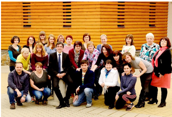
Obrázek 7 - Pedagogický sbor v roce 2016

V průběhu roku absolvoval poslední pedagog bez potřebné kvalifikace požadované studium, takže od školního roku 2016/2017 bude pedagogický sbor plně kvalifikovaný.