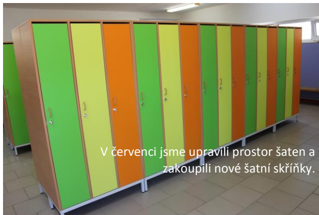
V červenci jsme upravili prostor šaten a zakoupili nové šatní skříňky.

V prázdninovém období roku 2013 vznikla v hlavní budově školní knihovna, zásadní přestavby se dočkalo sociální zařízení v Omáčkovně.