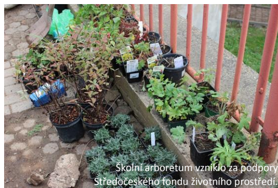
Skolní arboretum vzniklo za podpory Středočeského fondu životního prostředí.

Ve spolupráci s odbornou firmou vznikl rabatový záhon s použitím zejména postupně kvetoucích trvalek a trav v osluněné části vyvýšené plochy a olemování zastíněné cesty stínomilnými rostlinami. Záhon byl rozdělen na jednotlivé úseky: v bylinkové části jsou rostliny celoročního charakteru, dále pak pro úplnost sortimentu do keramické nádoby vysázené kultivary máty, výsadba byla doplněna dvouletými bylinkami, plocha byla zamulčována štěrkovým zásypem (rula, tufa). V záhoně byl vytvořen štěrkový průchod s podložením agrotexilií, aby bylinky byly snáze přístupné.