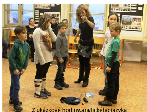
Z ukázkové hodiny anglického jazyka

Samostatnou kapitolou ve spolupráci s rodiči jsou setkání neformálního charakteru. Velká část rodičů má i přes snahu školy o změny obavy ze setkání s pedagogem. Možná jim školní chodby připomínají období jejich vlastní, třeba i nepříliš úspěšné, školní docházky, třeba se obávají nepříjemných informací týkajících se vlastního dítěte a procesu jeho výchovy a vzdělávání. Uvědomujeme si však také skutečnost, že vinu mohou v některých případech nést i pedagogové, kteří se ve vypjatých situacích vcelku logicky mohou dopustit chyb. Postupně však problémů pod vlivem strategií směřujících k žádoucímu rozvoji komunikace ubývá, což je jistě chvályhodné. Zejména pak při zvažování skutečnosti, že na řadě škol se děje pravý opak.