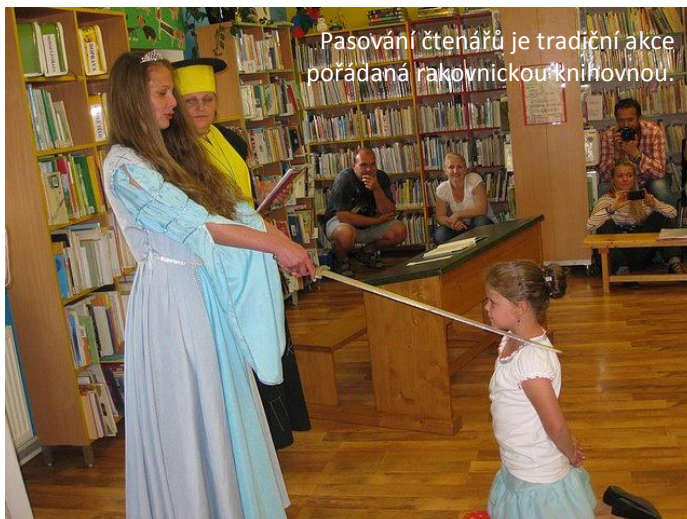
Pasování čtenářů je tradiční akce pořádaná rakovnickou knihovnou.

Do života škol v podstatě všech druhů více či méně zasahují nejrůznější projekty. Jejich přínos je často diskutabilní a je zcela klíčové správně se rozhodnout, pustí-li se škola do projektového martýria. I v případě na první pohled jednoduchých projektů představují povinné administrativní úkony neuvěřitelnou zátěž pro řadu lidí ve škole. Je proto s podivem, že si schvalovací orgány tuto skutečnost neuvědomily v případě Výzvy 56. Výzva 57 s termínem odevzdání na konci srpna a realizací do konce prosince je samostatnou kapitolou. Tyto skutečnosti však nic nemění na tom, že jsme pevně přesvědčeni o pozitivních dopadech, které budou obě výzvy mít na úroveň vzdělávacího procesu.