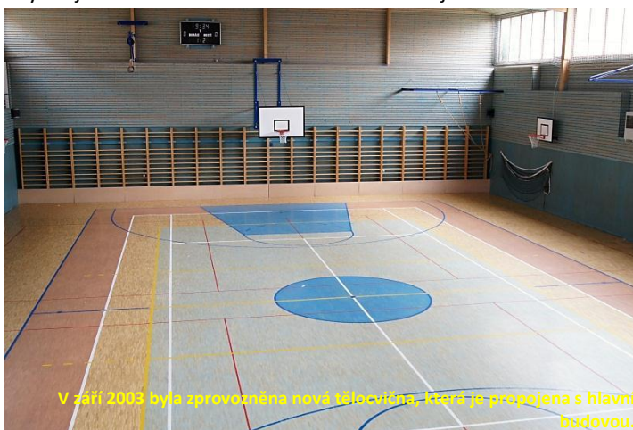
V září 2003 byla zprovozněna nová tělocvična, která je propojena s hlavní budovou.

Rekonstrukcí části komplexu školních dílen jsme vytvořili vhodné prostory pro keramickou dílnu. Od září 2012 ji začali využívat žáci a pedagogové nejen pro pořádání výtvarných kroužků, ale také při výuce. Dílna disponuje potřebným zázemím včetně elektrické vypalovací pece a hrncířského kruhu.