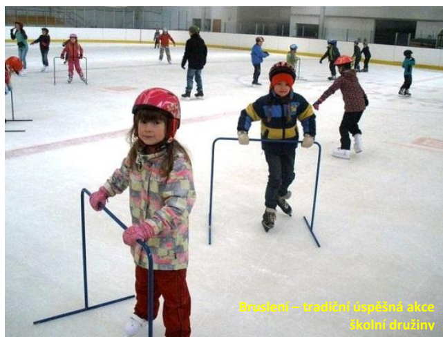
Bruslení – tradiční úspěšná akce školní družiny