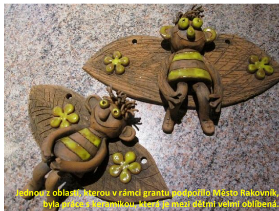
Jednou z oblastí, kterou v rámci grantu podpořilo Město Rakovník, byla práce s keramikou, která je mezi dětmi velmi oblíbená.

Středočeský kraj, Fond životního prostředí a zemědělství podpořil projekt školního arboreta, jehož realizace potrvá do roku 2015.