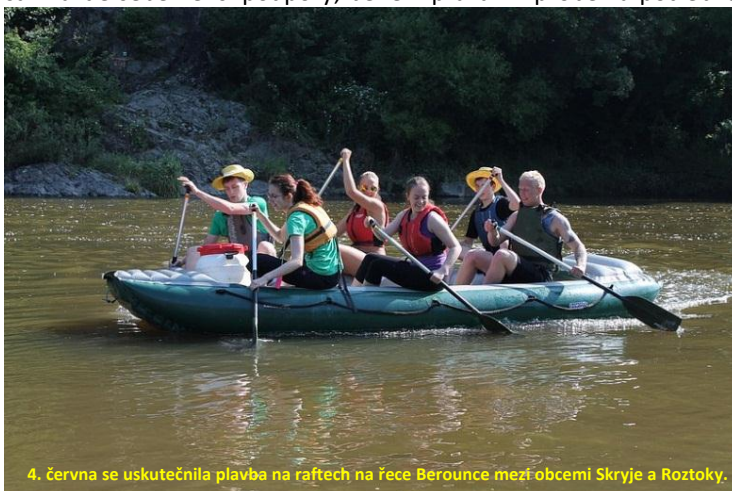
4. června se uskutečnila plavba na raftech na řece Berounce mezi obcemi Skryje a Roztoky.

24. června jsme ocenili 24 žáků nominovaných na titul Čtyřlístek za školní rok 2013/2014. V rámci stejnojmenného školního programu měl každý pedagog právo nominovat jednoho z žáků školy, který podle jeho osobního názoru dělal v průběhu roku čest škole. Rozhodování nebylo vůbec jednoduché a osobně věřím, že v příštím školním roce bude ještě složitější, neboť kvalitní práce učitele utváří úspěšné žáky.