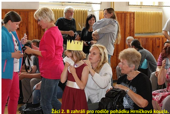
Žáci 2. B zahráli pro rodiče pohádku Hrnčíková kouzla.

Spolupracujeme se sdružením rodičů. Zástupci rodičů jednotlivých tříd jsou aktivní, vstřícní, zajímají se o chod školy a iniciativně napomáhají vedení školy při řešení problémů. Sdružení rodičů také finančně podporuje aktivity školy.