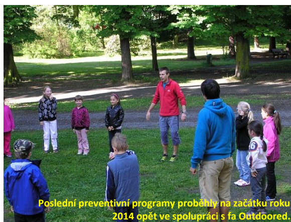
Poslední preventivní programy proběhly na začátku roku 2014 opět ve spolupráci s fa Outdoored.

Klíčovými z hlediska boje proti nežádoucím projevům v chování však byly také následné preventivní programy (první kolo proběhlo již v roce 2012/2013), které proběhly na začátku roku. Ve spolupráci s lektory společnosti Outdoored, s. r. o. jsme opět zajistili jednodenní program zaměřený na rozvíjení důvěry mezi muži a ženami, budování pozitivního sociálního klimatu ve třídě, na problematiku šikany a jejích forem včetně