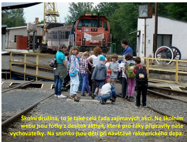
Školní družina, to je také celá řada zajímavých akcí. Na školním webu jsou fotky z desítek aktivit, které pro žáky připravily naše vychovatelky. Na snímku jsou děti při návštěvě rakovnického depa.

Ve školním roce 2013/2014 byla z důvodu velkého zájmu rodičů rozšířena školní družina