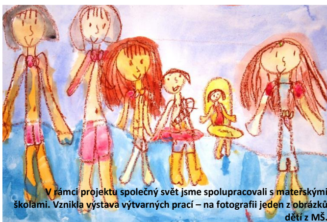
V rámci projektu společný svět jsme spolupracovali s mateřskými školami. Vznikla výstava výtvarných prací – na fotografii jeden z obrázků dětí z MŠ.